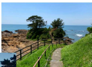
遠くに富士山が見えます(↓)。