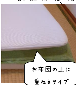
お布団の上に重ねるタイプ