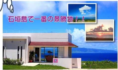
石垣島で一番の景勝地！！