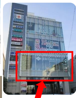
こちらにクリニックを拡大します